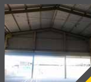
SISTEMA DE CALHAS