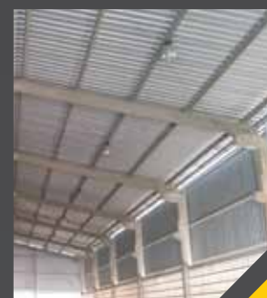
VIGA PARA PONTE